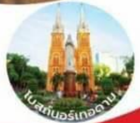
โบสถ์นอร์ทอดาม