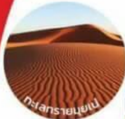
ทะเลทรายมุยเน่