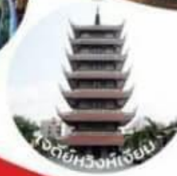
วัดโฮจิมินห์